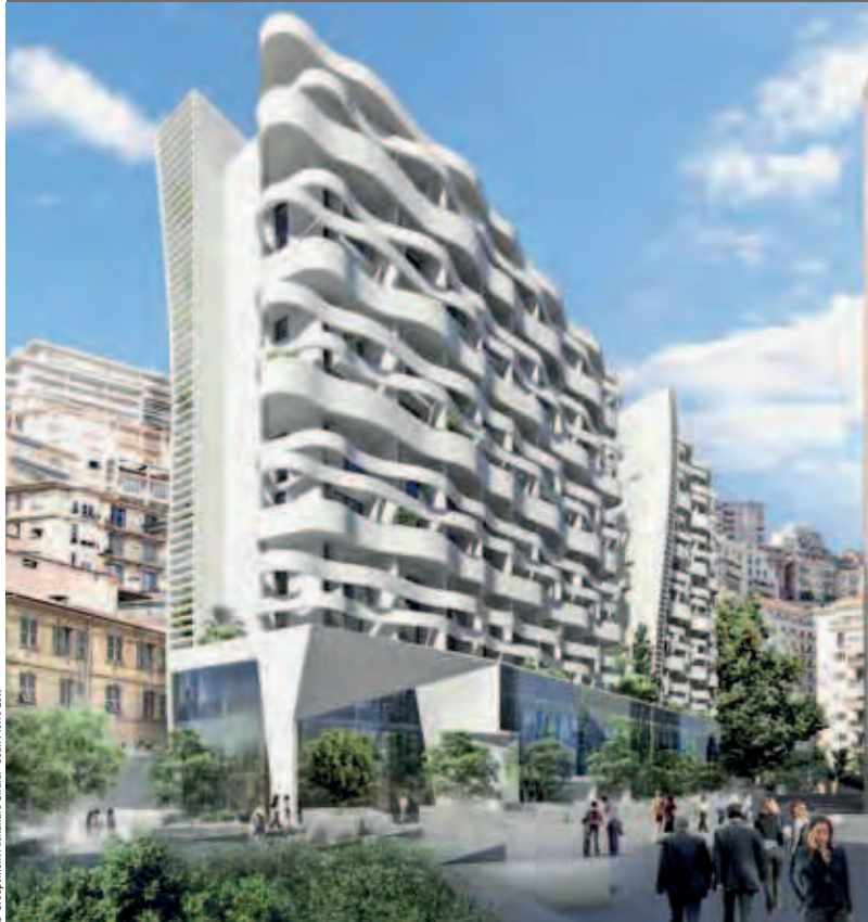
© Groupement Alexandre Giraldi - Jean-Pierre Lott