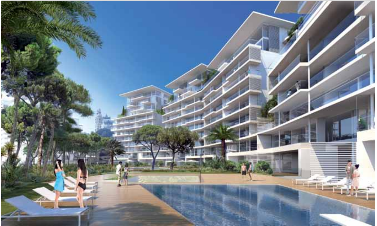
Les futurs immeubles.

calendrier des travaux qui doivent s'échelonner sur une dizaine d'années. Ils débuteraient au 4 ème trimestre 2016, l'année 2020 marquant l'achèvement de l'infrastructure maritime et le commencement des superstructures. En 2022 seront livrés les premiers bâtiments, deux ans plus tard, le port d'animation et l'extension du Grimaldi Forum, la fin des travaux étant prévue en 2025. Le quartier constituera une nouvelle façade maritime bordée, d'un côté par le Fairmont de l'autre par le Larvotto, il sera organisé en trois parties : le port, la colline qui reliera le Jardin japonais, le Grimaldi Forum et le front de mer, les « jar-