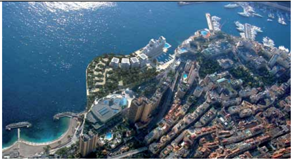
Vue aérienne virtuelle du Portier après construction.

“ En 2022 seront livrés les premiers bâtiments, deux ans plus tard, le port d'animation et l'extension du Grimaldi Forum. ”